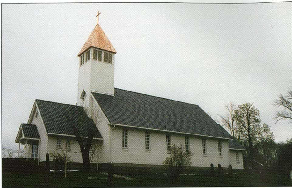
Det er også hun som har tatt forsidebildet til dette nummer av Pensjonist-nytt.

Den 6. juni 1999 ble en gledens dag for befolkningen i Frogn. Da ven nye kirken ble vigslet på det gamle kirkestedet Froen. Der hvor den gamle kirken lå, ligger nå en ny hvit murkirke, høyt og fritt som et naturlig innslag i landskapet.