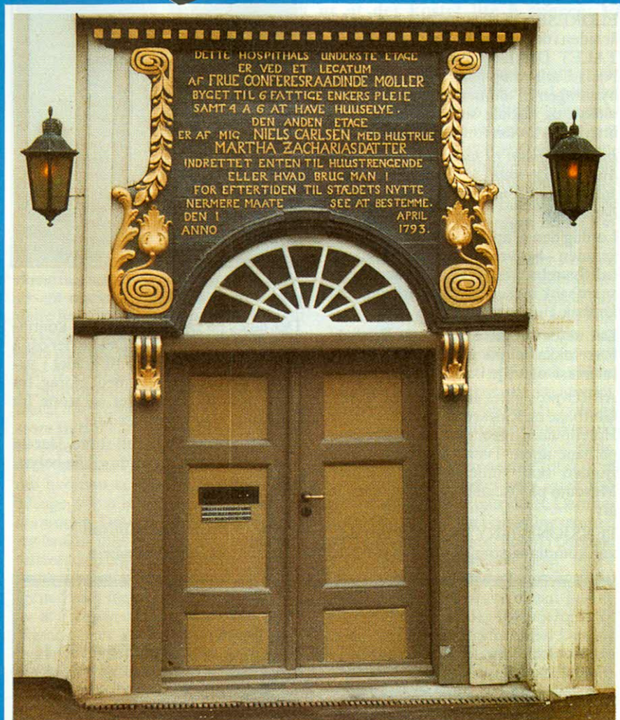
Hospitalet 200 år.

Utgitt av pensjonister ved Eldresenteret