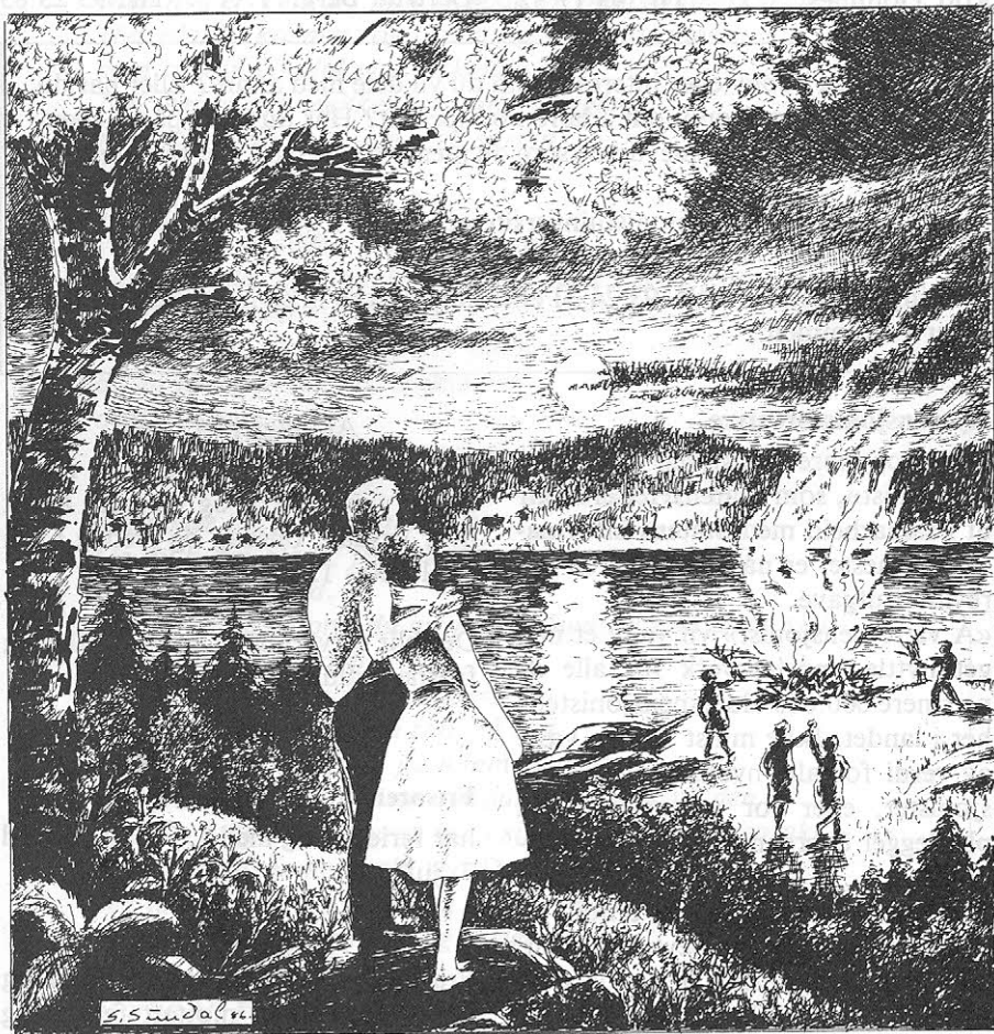
En midtsommerveld ved Drøbaksund